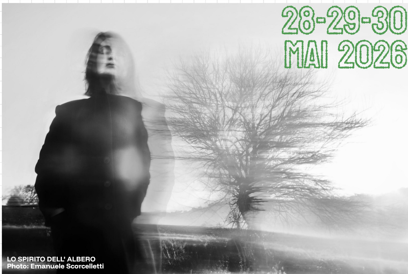
LO SPIRITO DELL' ALBERO